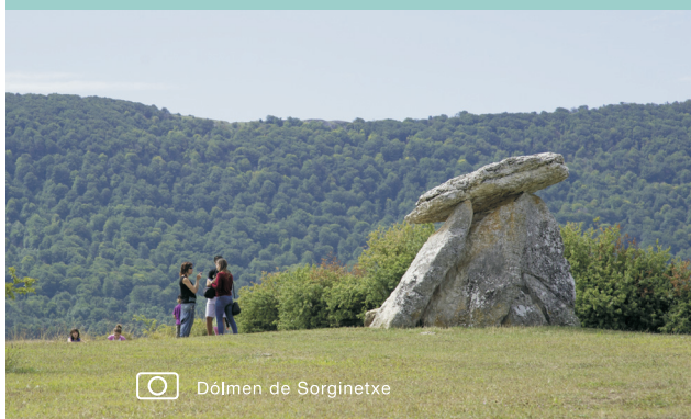
📍 Dólmen de Sorginetxe

OPAKUA > PEÑARROYA (1.070m) > BAYO (1.211m)