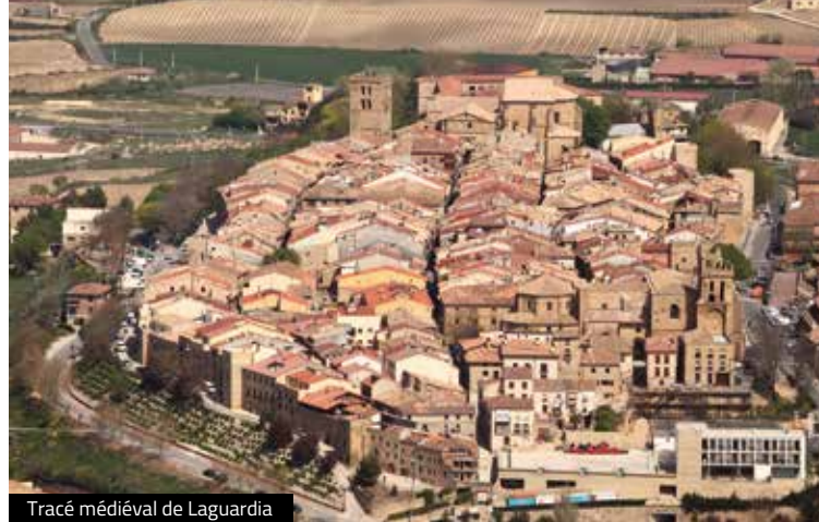
Tracé médiéval de Laguardia