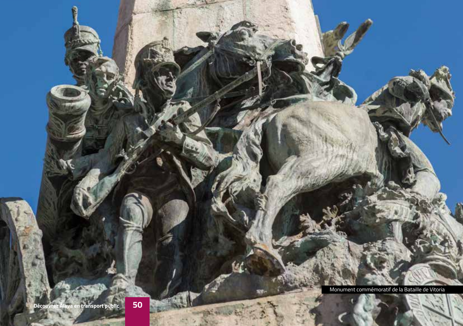
Monument commémoratif de la Bataille de Vitoria