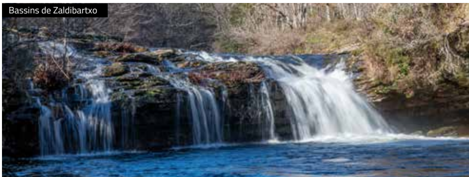
Bassins de Zaldibartxo