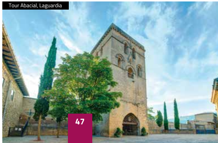
Tour Abacial, Laguardia