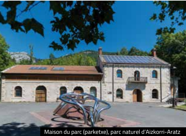
Maison du parc (parketxe), parc naturel d'Aizkorri-Aratz