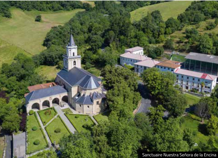
Sanctuaire Nuestra Señora de la Encina