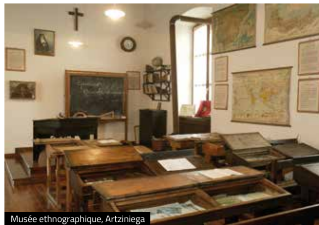
Musée ethnographique, Artziniega