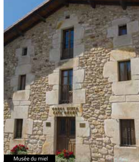
Musée du miel

Les plans continuent à Murgia et son Musée du miel , situé dans la Casa Oregi, où vous plongerez dans le monde fabuleux de l'apiculture : où et comment est produit le miel de la zone du Gorbeia.