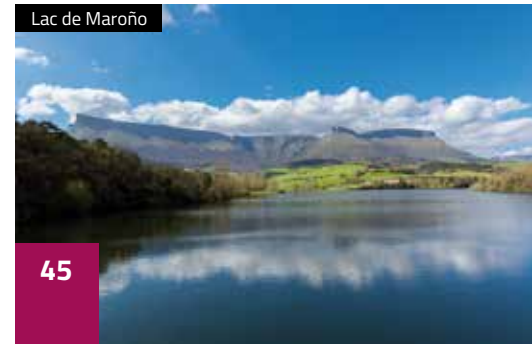
Lac de Maroño

À un saut du centre historique d'Artziniega se dresse le sanctuaire de Nuestra Señora de la Encina, dont la construction date de la fin du XVe siècle et début du XVIe. Son retable, les peintures de ses voutes, la figure romane de la Vierge et ses huit autels sont quelques-uns des éléments qui font sa richesse artistique et esthétique.