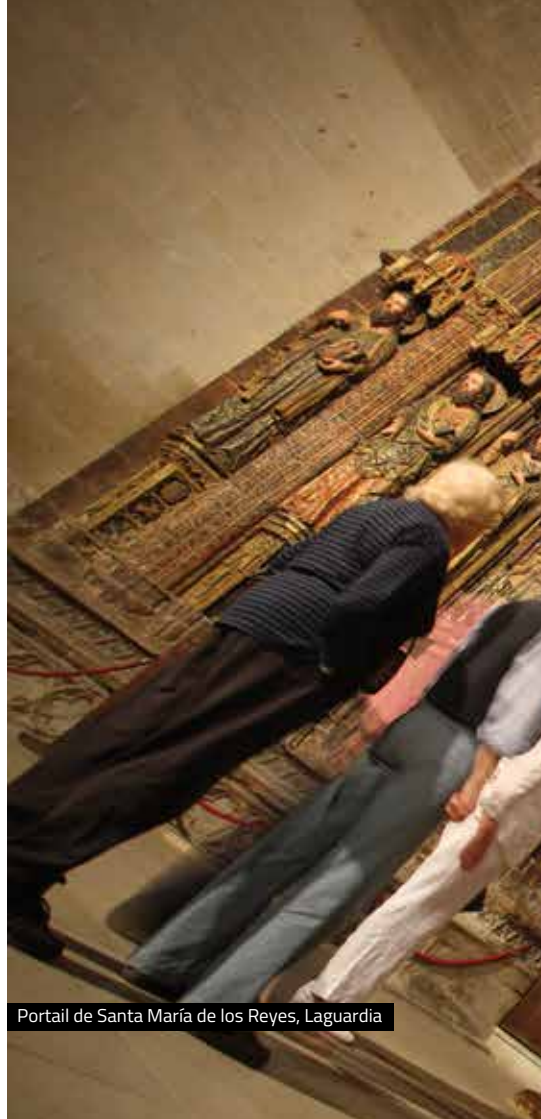
Portail de Santa María de los Reyes, Laguardia

Voici un autre des villages de Rioja Alavesa qui exigent une halte pour déguster, à travers tous les sens, toute la richesse de son patrimoine historique et architectural, et bien sûr, de ses caves et de ses vins.