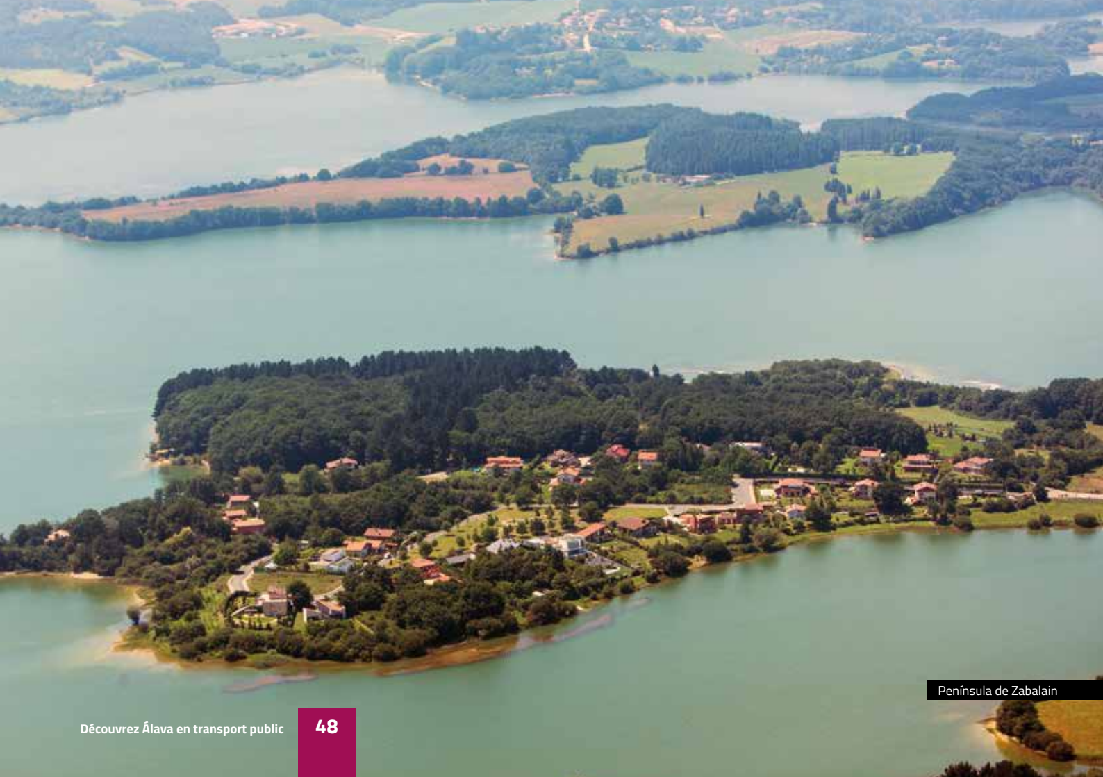
Península de Zabalain