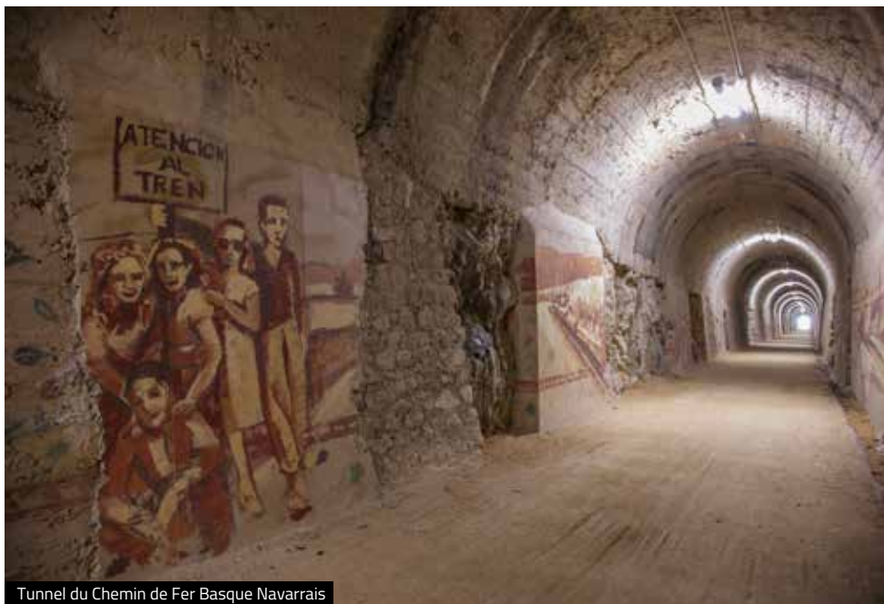
Tunnel du Chemin de Fer Basque Navarrais

Dans la zone de l'ancienne gare, dans trois wagons de train, le Centre d'Interprétation de la Voie Verte du Chemin de Fer Basque Navarrais , qui est aussi l'office de tourisme, vous ouvre ses portes. Et près de l'ancien quai de chargement vous attendent une aire de loisirs et un service de location de vélos.