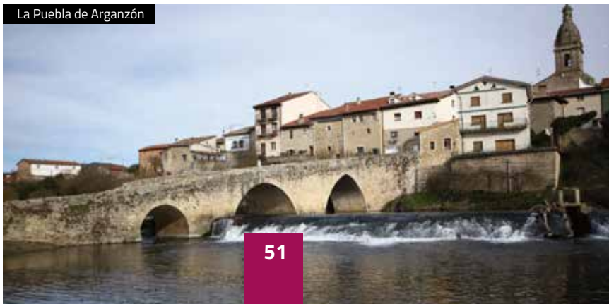
La Puebla de Arganzón

Zadorra, l'Hôpital de San Juan et la chapelle Nuestra Señora de la Antigua, situés autrefois hors de ce qui était une enceinte fortifiée, l'église Nuestra Señora de la Asunción et les gisements archéologiques mis au jour près du Château d'Arganzón, sont les ressources qui font de La Puebla de Arganzón une visite pleine d'intérêt.