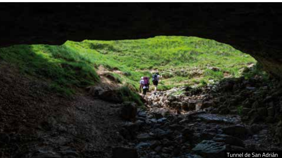
Tunnel de San Adrián