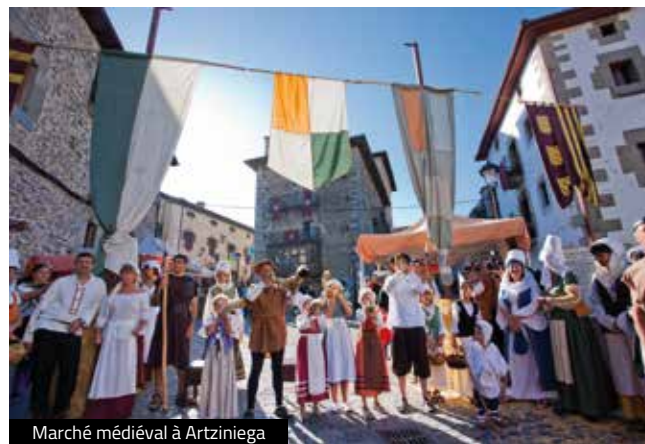
Marché médiéval à Artziniega

Pour accéder à Artziniega depuis Vitoria-Gasteiz, vous devrez d'abord prendre la ligne 15 puis la ligne 16.