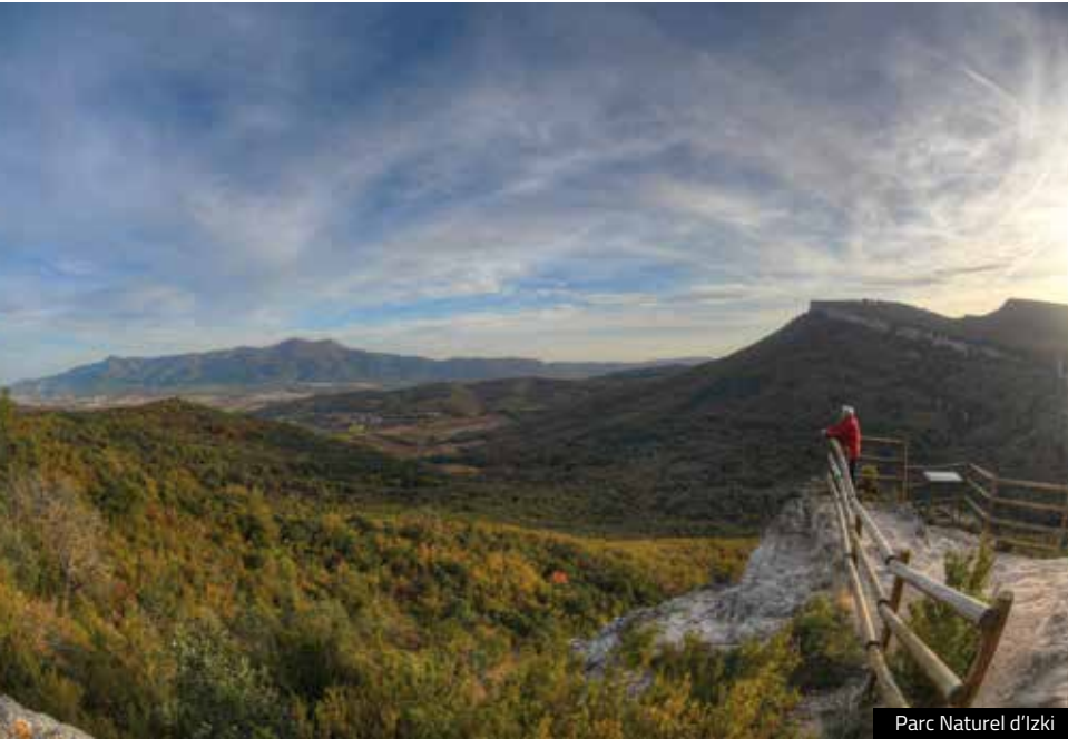
Parc Naturel d'Izki